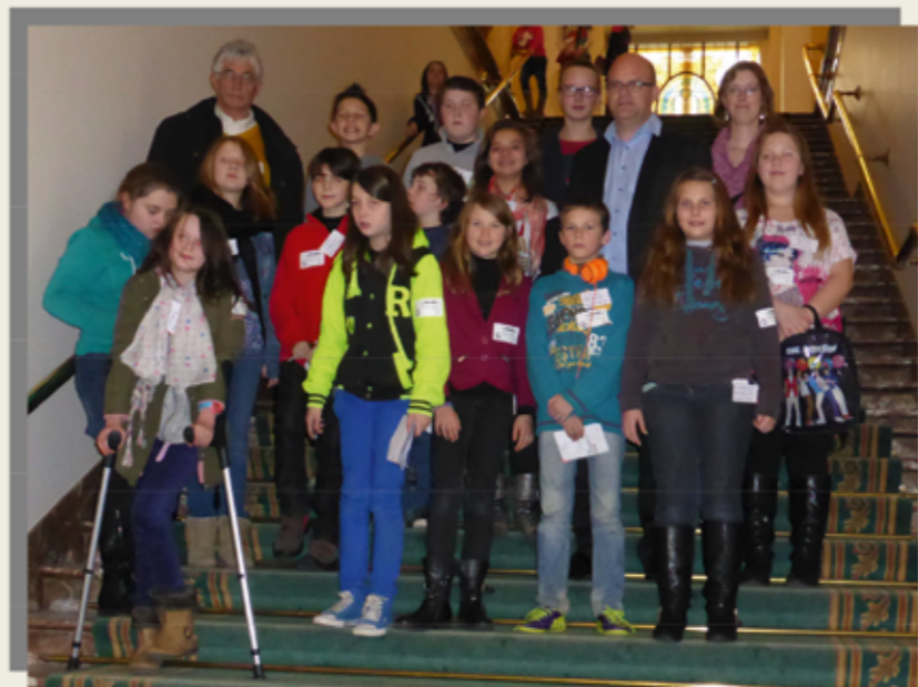
Participation à la journée découverte du Parlement à Bruxelles, organisée par le Conseil provincial des Jeunes.