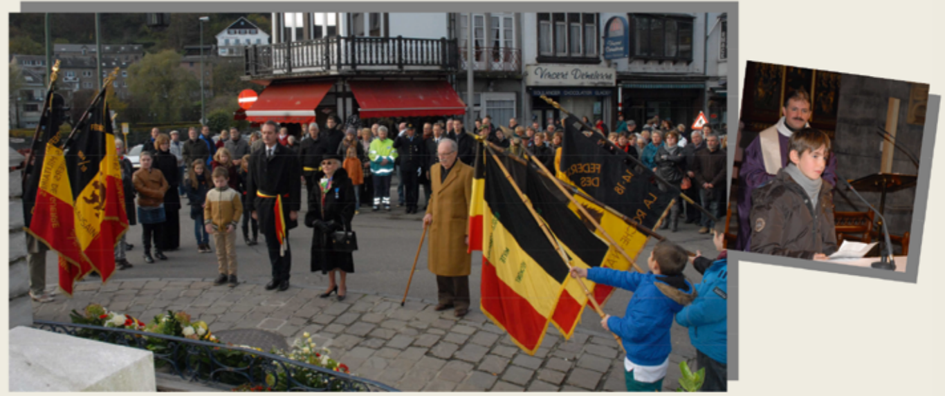
Présence aux commémorations du 11 novembre.