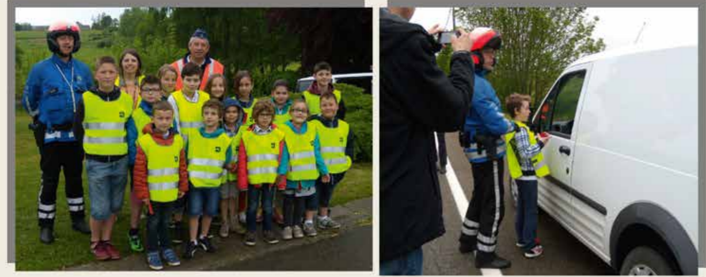
Action de sensibilisation à la sécurité routière aux abords de nos écoles.

Un tout grand merci aux jeunes conseillers, à tous les élèves qui se sont investis cette année avec beaucoup d'enthousiasme dans leurs différents projets aussi variés qu'enrichissants.