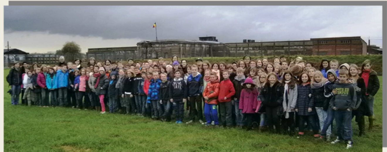
Visite « Prise de conscience » au Fort de Breendonck.